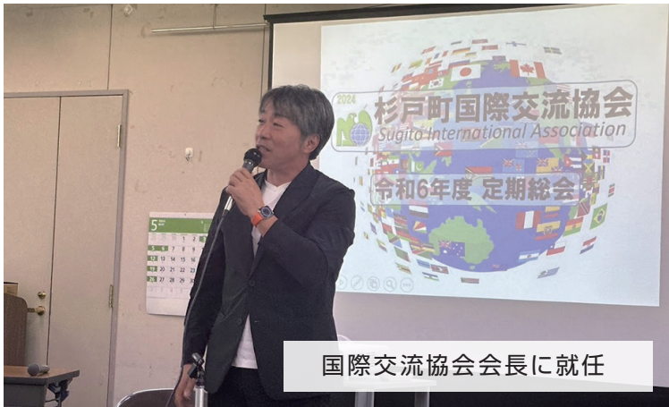
国際交流協会会長に就任