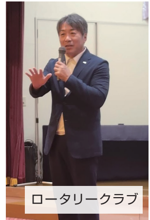
ロータリークラブ