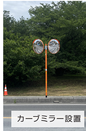
カーブミラー設置