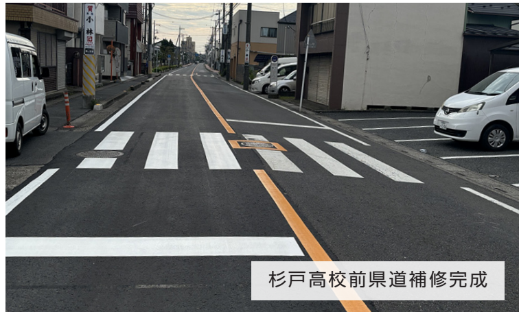
杉戸高校前県道補修完成