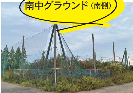
南中グラウンド（南側）