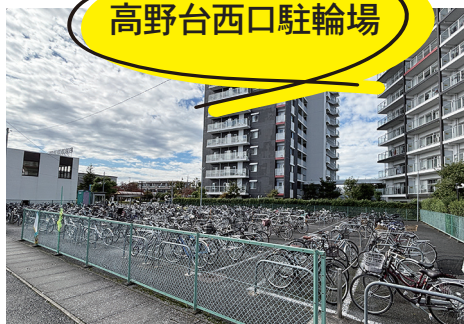
高野台西口駐輪場